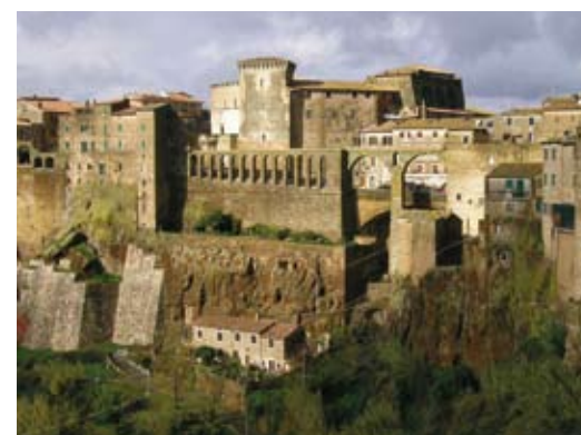
Le mura di Pitigliano e, sopra, le acque calde di Saturnia. In apertura un casale per agriturismo a Magliano. L'itinerario è stato pubblicato da Case & Country, il mensile di Class Editori